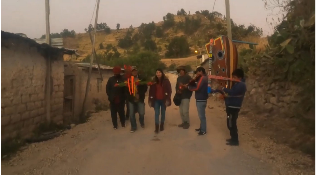
Figura N°1: Típico Ritual Andino del Techado de la Casa en Ayacucho - Perú

a dicho ritual del Techado. (Ver Figura N°1)