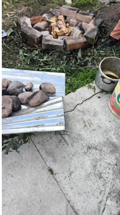
Figura 3: Pachamanca en zona Urbana del Distrito de Los Olivos