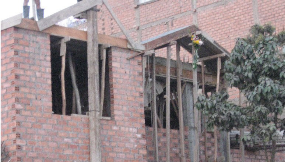
Figura N°6: Típico Ritual Urbano del Techado de la Casa en el Distrito de Los Olivos